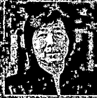
Siti Mina Tamah Widya Mandala Catholic University Indonesia

For more details and registration, please visit www.culi.chula.ac.th/research